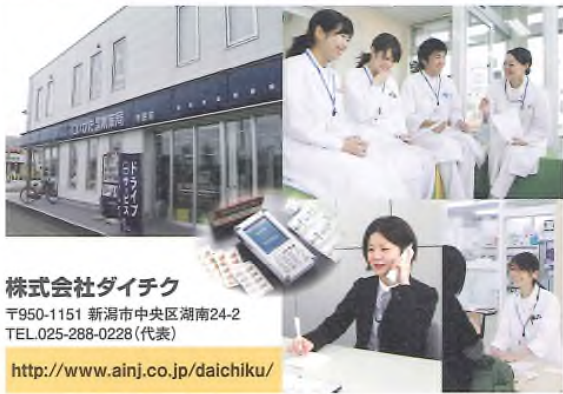
株式会社ダイイチ 〒950-1151 新潟市中央区湖南24-2 TEL.025-288-0228(代表) http://www.ainj.co.jp/daichiku/

平成24年3月現在、社員290名、年商約90億円。ここに至るまで経営理念の根幹を支え、これを実現すべく自己研鑽を重ねる社員を「にいがた調剤薬局」及び「アイン薬局」の財産として、今後も医療の一翼を担い、患者さま志向を貫き研鑽してまいります。