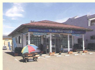
株式会社カンエー・ハウジング 〒943-0807 新潟県上越市春日山町3丁目18-44 TEL.025-527-6541 FAX.025-527-6542 ホームページ http://www.kan-eh.jp/

皆様が既に実感されている通り、ITの進化には目を見張るばかり。四半世紀を経た今、不動産売買の仲人役を存分に果たせるのも、近年の情報通信技術の進展。こん