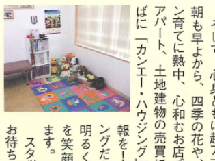
スタッフ一同、心よりお待ち申し上げます。

小さな店に、所狭しと並ぶパソコンや受話器は、無休でお客様の声を連日続ける。常に2〜3人のスタッフが応対し、その光景は活気に満ち溢れています。一本の電話からご縁をいただき、めでたく成約のお客様に「おまんだ処で家を世話してもうってから、嫁さんと孫まで恵まっています。良いことづくめでだわ」と嬉しいお言葉。これからもずっと皆様の「パワースポット」の一つとして、幸福発信基地であり続けるよう精進を重ねます。 近頃は、豊富な情報をお持ちのお客様達に、もう負けそう！早速、光ケーブルを導入。多様化するニーズに答えようと、6名のスタッフが今流行の「インバション」「ホスピタリティ」にと、若い力を仲良く発揮中。 宇宙とF1、コンピュータ大好き店長 ガラス張り理のりっけり会計人 キムタクもびっくり!!脱帽の営業課長 山ボーイよろしく!!ダイエツ中の次長 さわやかな接客が売りの天然アツ中 ゆとり世代の申し子は、スカルアップ そして、心身ともに超アナログ社長は、今朝も早よから、四季の花や、グリーンカーテン育てて熱中、心とお店つくりで大貢献。アパート、土地建物の売買には、いつもおそばに「カンエー・ハウジング」とうか電話情報を「カンエー・ハウジング」だからこそできる、明るく元気なサービスを笑顔でお届けいたします。