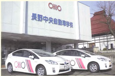
長野中央自動車学校

ホームページ http://www.nagano-drivingschool.com/