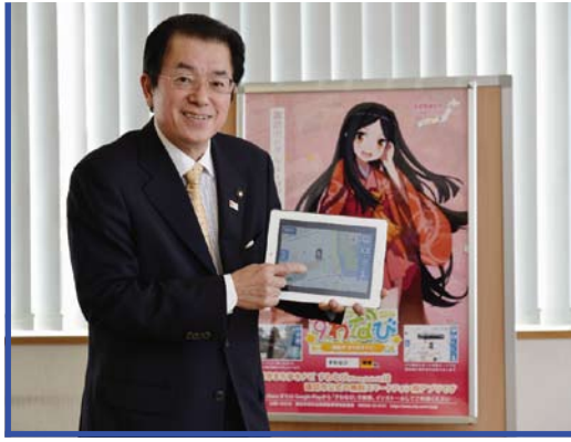
使い勝手のよさを強調する山田勝文諏訪市長。諏訪市のホームページでも自らPRを展開

昨秋、スマートフォン・タブレット端末向けまち歩きナビゲーションアプリ「諏訪市まち歩きナビ」を本格稼働させた諏訪市。アニメ風キャラクターもさることながら、情報内容の充実ぶりや、ユーザー視点の使い勝手のよさに、「行政がここまで？」と驚きや感動の声が寄せられている。先頭に立つて開発指揮とPRにあたった諏訪市長と、実際に開発に携わったお二人に経緯をうかがった。