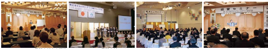
電話応対向上研修

当協会は、公益法人として今年2年目を迎えますが、当協会の目的である情報通信技術・サービスを利用したコミュニケーション文化の振興を図るとともに、利用者の利便増進に寄与し、地域社会の発展に努めてまいりますので、引き続き、皆様の積極的なご参加と、ご支援・ご協力を何卒よろしくお願い申し上げます。